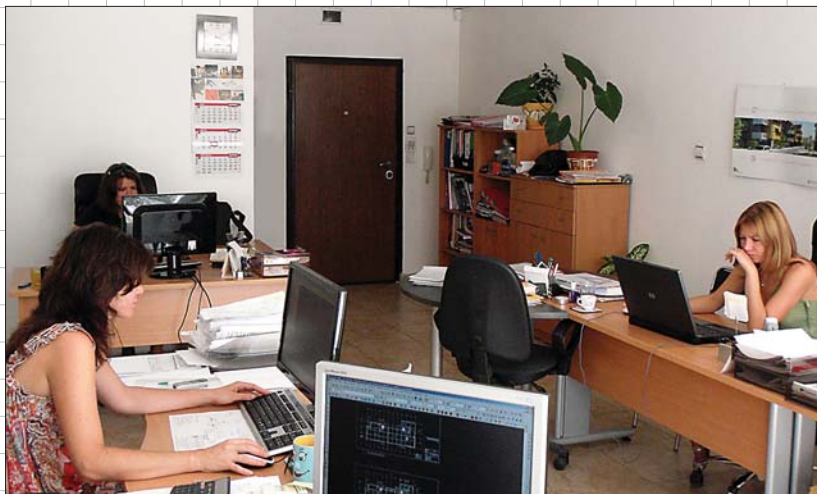
Специализираните софтуерни продукти използвани в "ХЕС - България" ООД повишават производителността на екипа

При проектирането на ОВК инсталации са ни необходими софтуерни продукти за изчисляване и изчертаване на инсталациите. За изчисленията на топлинните загуби и охладителните товари използваме програмата FINE-HVAC на фирма 4M. За изчертаване и оразмеряване на вентилациите използваме програмата AX-3000 на фирма ESS GmbH. За избор на помпи използваме софтуер на WILO. Изчисленията на разширителни съдове се извършват с програмата на Reflex. За избор на вентилатори, вентилационни и климатични камери